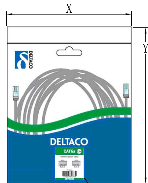
50*57mm barcode label Will be changed by product

NOTES: UNLESS OTHERWISE SPECIFIED (注意: 重點詳細說明)